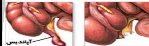
قبل از عمل بعد از عمل